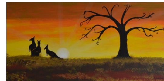
'Droomtijd', Corina Klerkx, 2015, Acryl op canvas

Als singer-songwriter schrijf ik op maat gemaakte songs die aansluiten bij het door jou gekozen symbool of jouw ceremonie. Een lied over jÓuw gevoelens, jÓuw levensverhaal. Denk maar aan een ballade tijdens jouw huwelijksceremonie of een song tijdens een herdenkingsdienst van een dierbare overledene. Of wat te denken van een naamgevingsceremonie met een speciaal lied voor jouw pasgeboren kindje? Of misschien ben je ernstig ziek en wil je iets bijzonders nalaten?